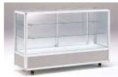
デラックスケース